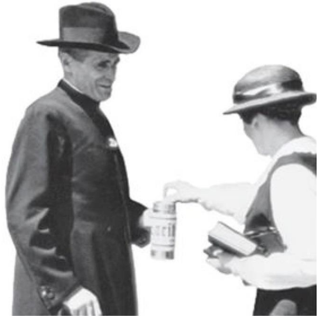
Jesuitenpater Rupert Mayer, Patron der Caritas im Erzbistum, sammelte schon 1935 mit der Caritas-Büchse vor St. Michael in der Münchner Fußgängerzone.

Die Sammlungsgelder werden für die soziale Arbeit und soziale Aufgaben vor Ort verwendet. 40 Prozent verbleiben in der Pfarrgemeinde und 60 Prozent gehen an die örtliche Caritas, die damit Menschen in Not unterstützt und Dienste finanziert, die nicht genügend öffentliche Förderung erhalten.